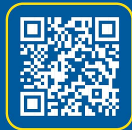
TABELLA DI RIFERIMENTO VARIAZIONE PREZZO TONDO PER CEMENTO ARMATO 2026